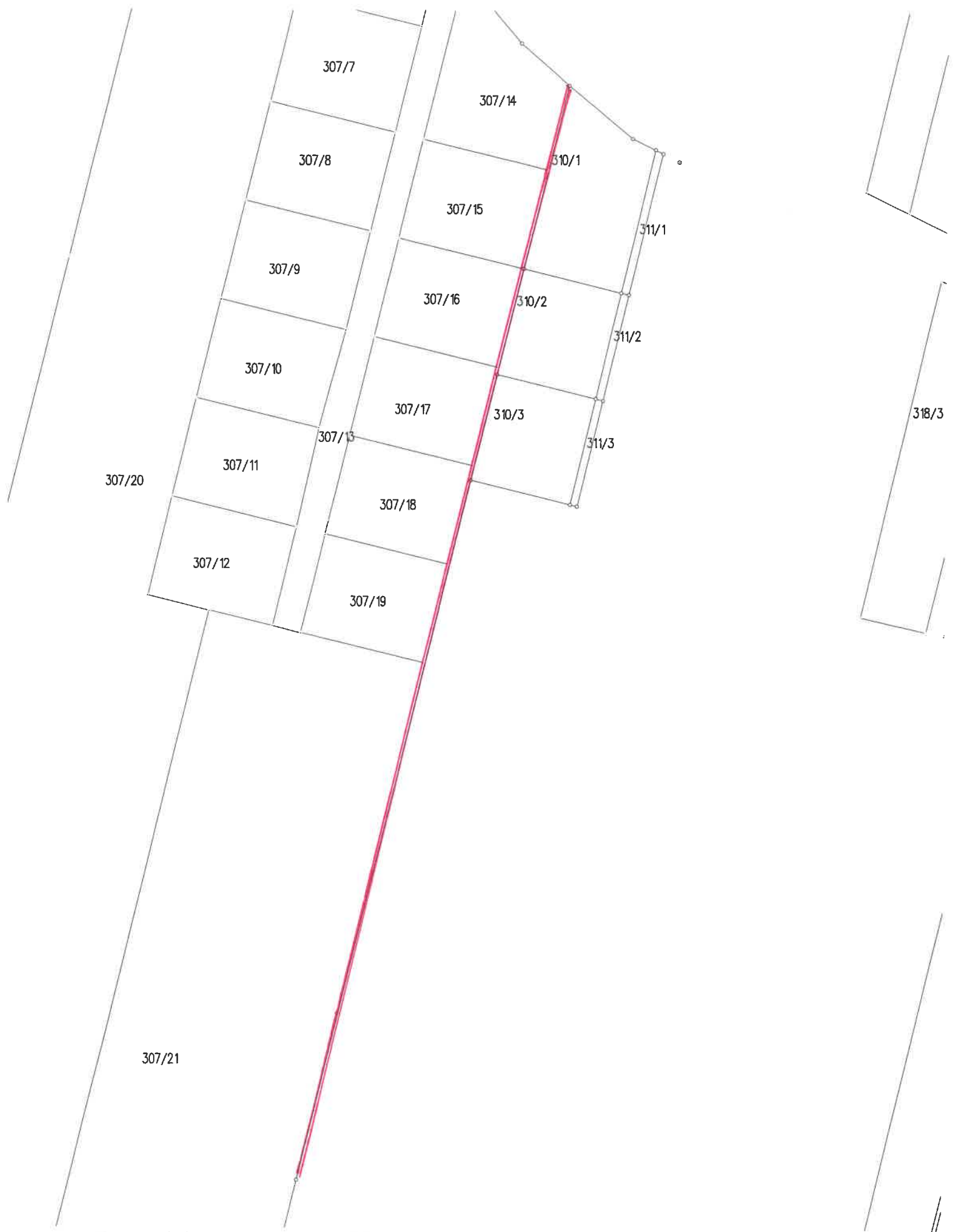
Mapa poglądowa dla zadania 1 – granica sporna