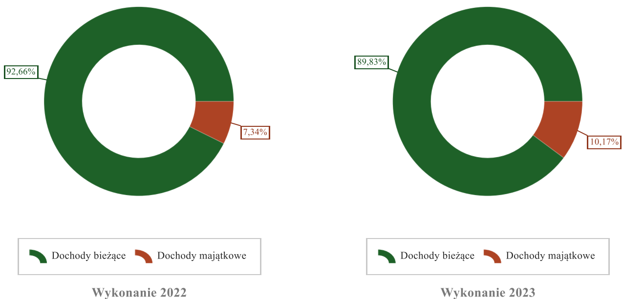
Wykres 1: Struktura dochodów ogółem Miasta i Gminy Piekoszów w 2023 roku w porównaniu do roku 2022.